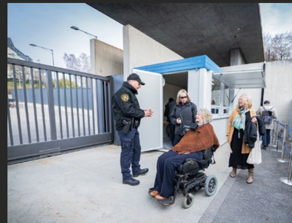
Des agents du Service de la sécurité et de la sûreté aident des personnes handicapées à accéder au Palais des Nations.