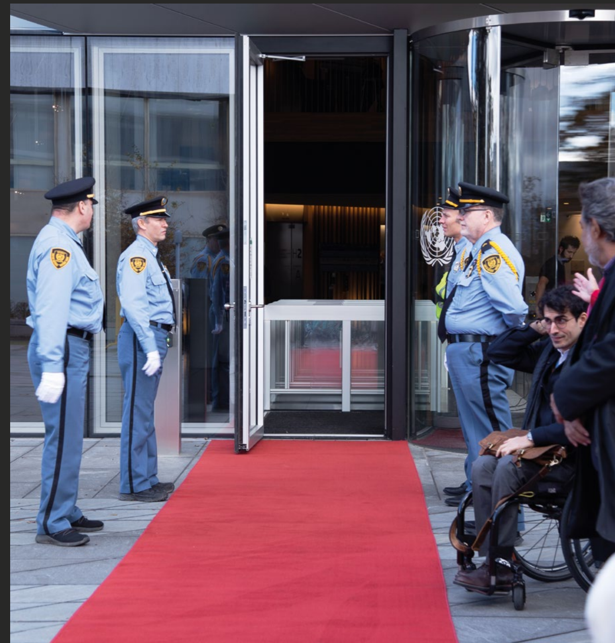
Des membres du protocole et des agents du Service de la sécurité et de la sûreté se préparent à accueillir des visiteurs de haut niveau.