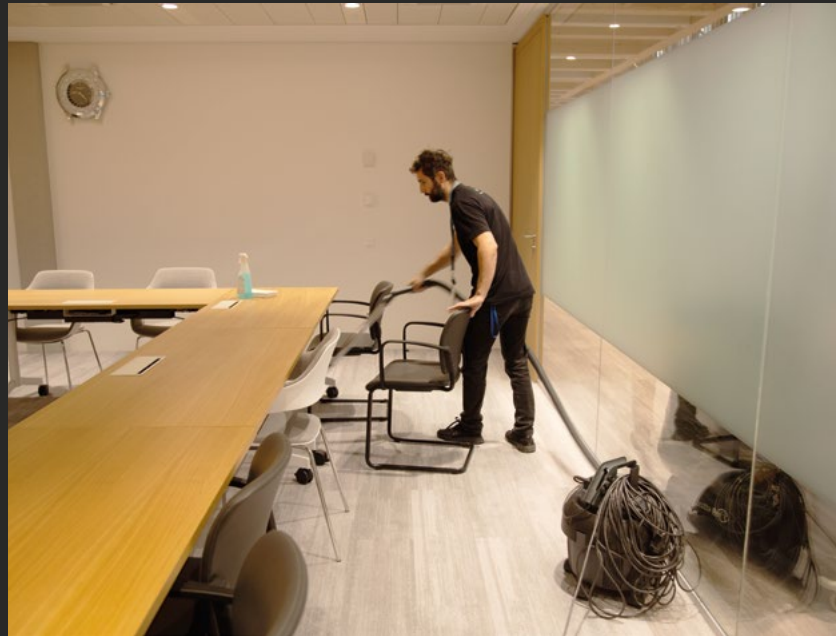
Un agent d'entretien nettoie une salle de réunion dans le bâtiment H.