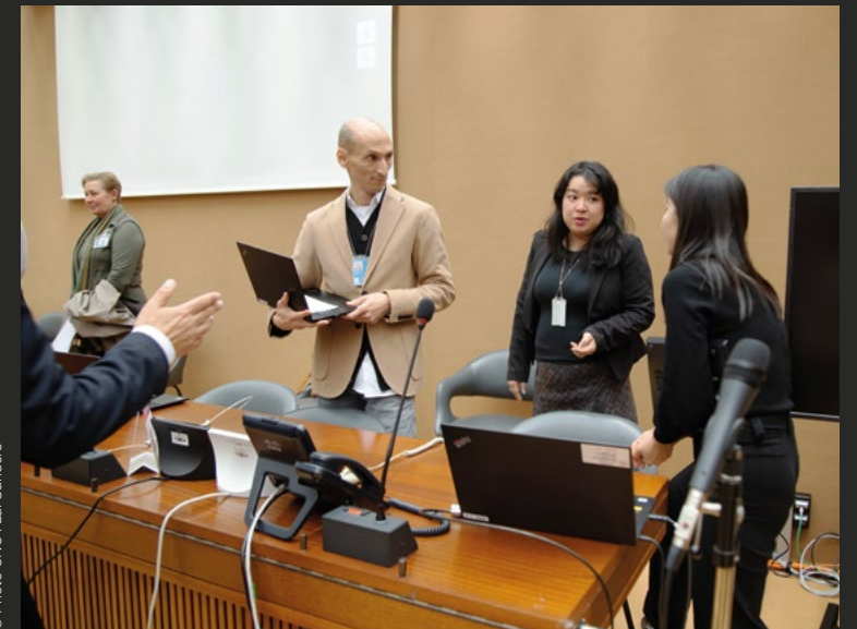
Une fonctionnaire du Service de Genève du Bureau des affaires de désarmement assiste des représentants.