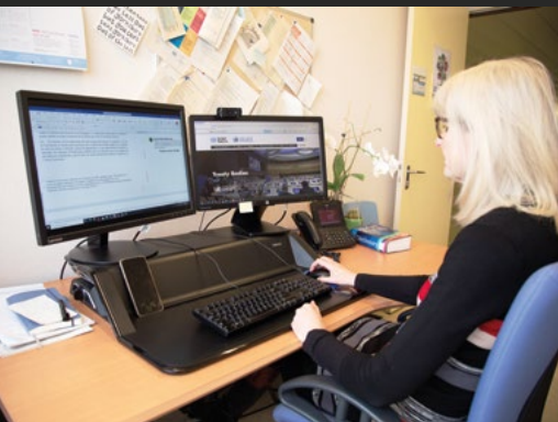
Une éditrice corrige des documents pour une réunion afin d'en garantir la qualité.