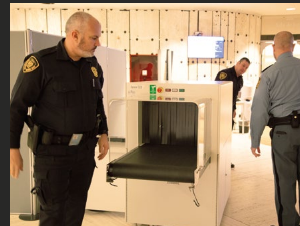
Des agents du Service de la sécurité et de la sûreté installent un scanner à rayons X devant une salle de conférence.