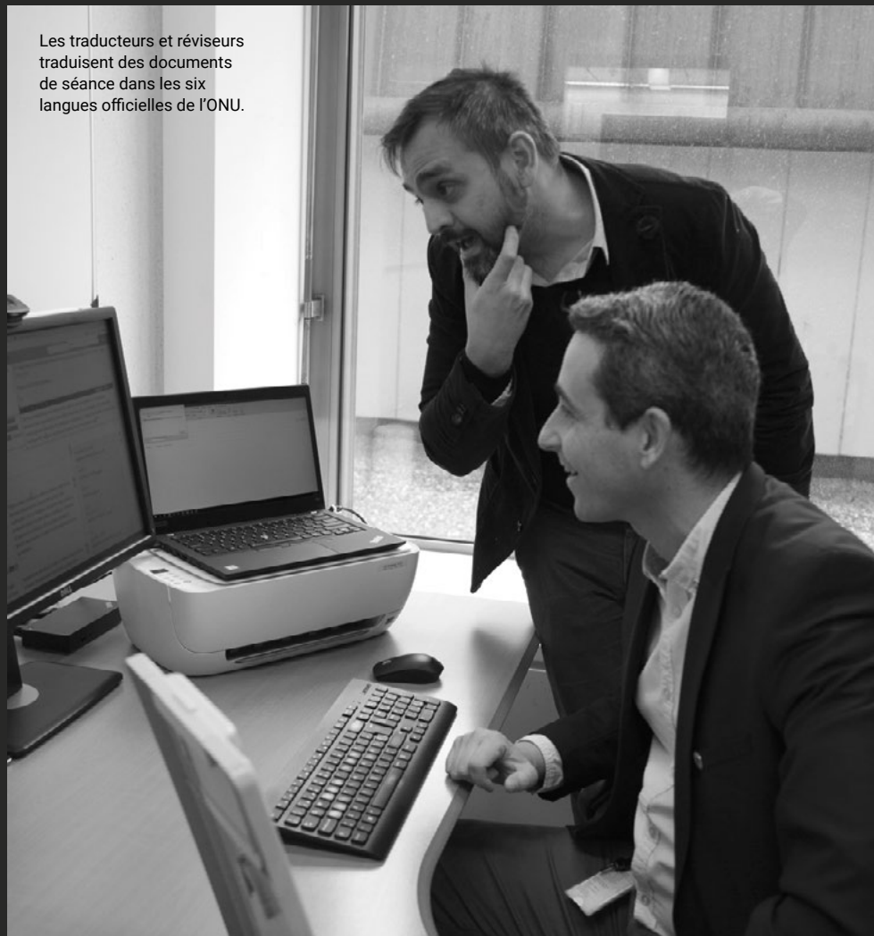
Les traducteurs et réviseurs traduisent des documents de séance dans les six langues officielles de l'ONU.