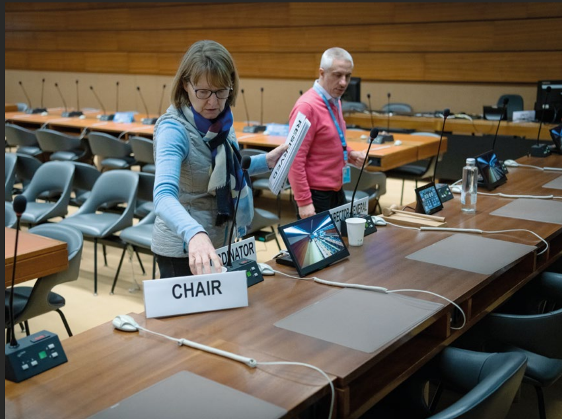
Une fonctionnaire du Cabinet de la Directrice générale installe des plaques nominatives pour une réunion.