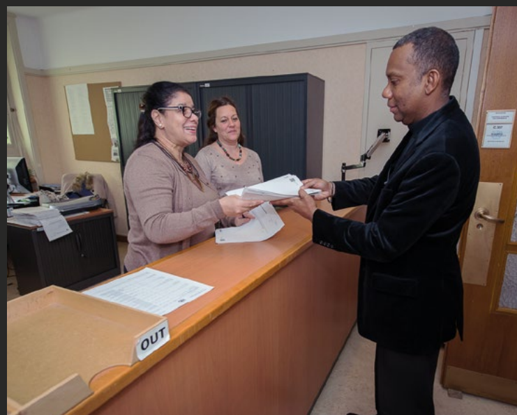
Des fonctionnaires de la Division de la gestion des conférences distribuent des documents de conférence à un comptoir.