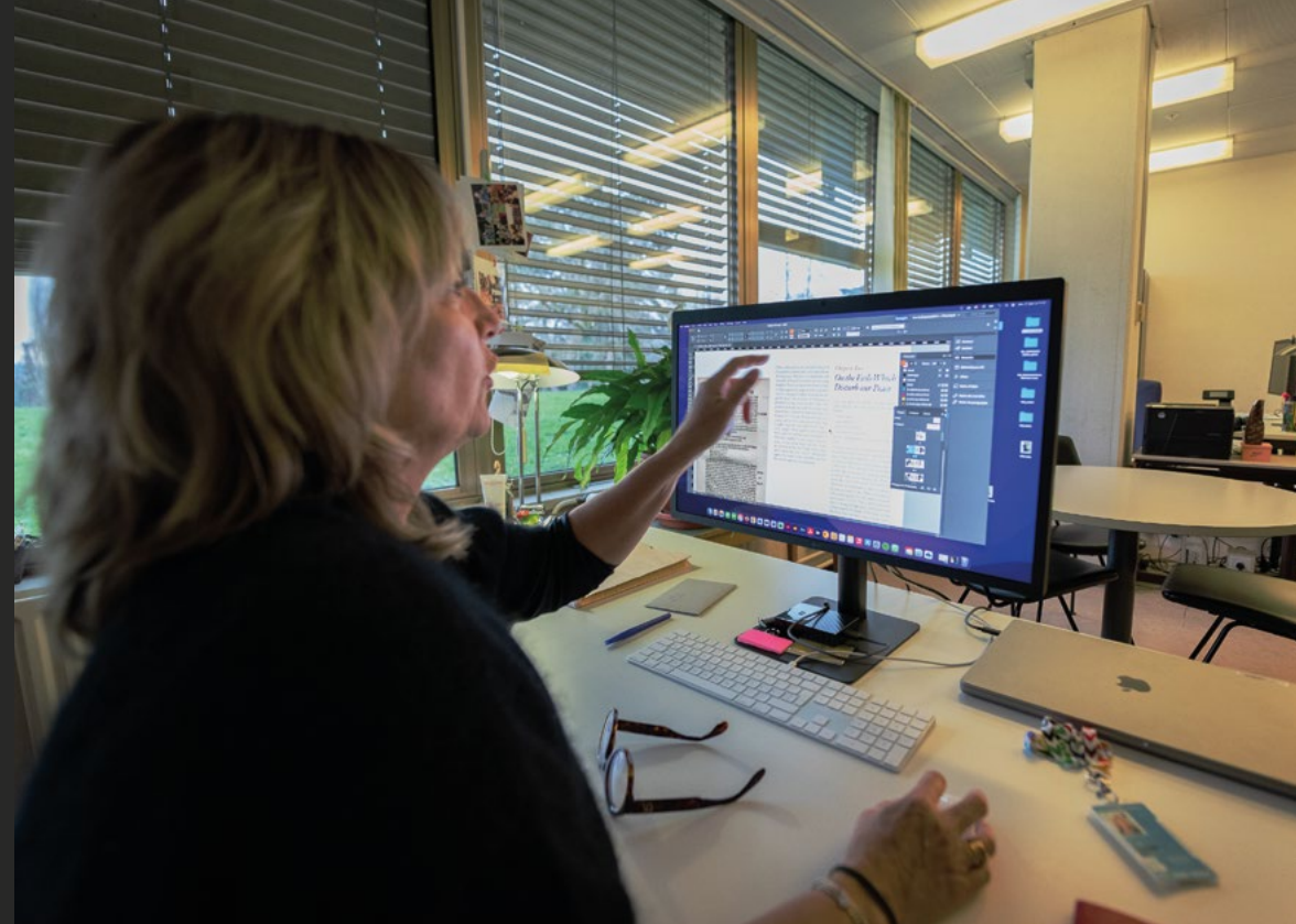
Une graphiste travaille sur un rapport.