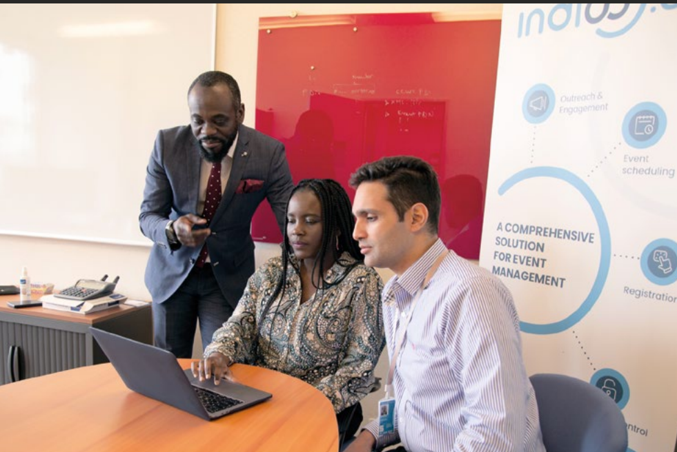
Des membres du personnel de la Division de la gestion des conférences travaillent sur Indico, le portail que les gens utilisent pour s'inscrire à des réunions et à des événements à l'ONU Genève.