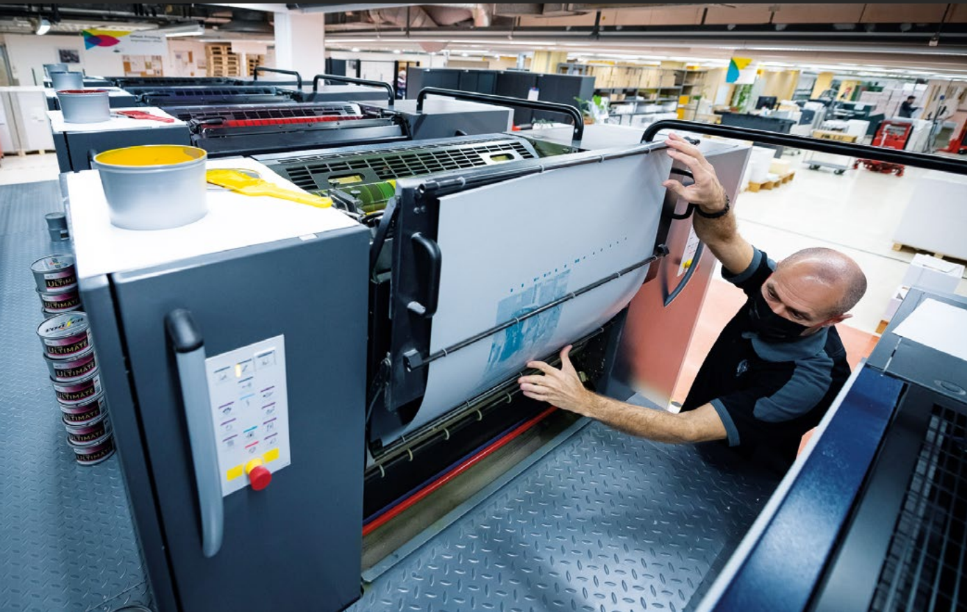
Dans l'imprimerie de l'ONU Genève, un fonctionnaire supervise l'impression des documents et des publications.