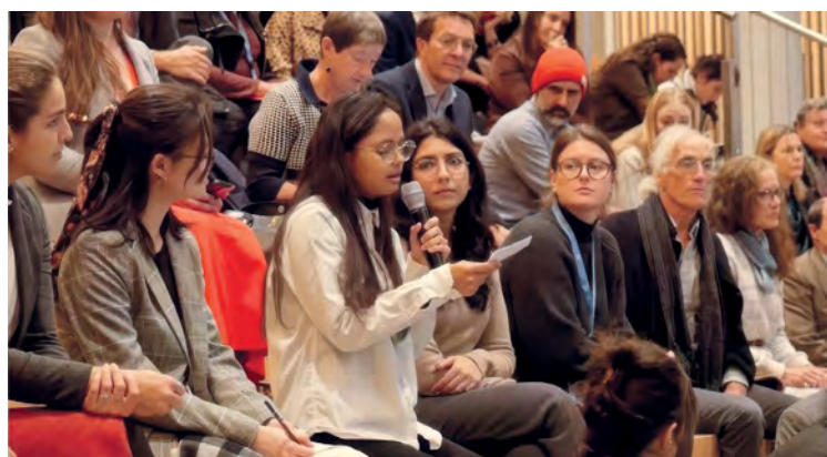
Des étudiants en master de l'Institut de hautes études internationales et du développement de Genève posent des questions sur le rôle de l'art et des médias à la rencontre « So What's Next » que le SDG Lab a consacrée aux émotions et à la durabilité, le 29 novembre au Palais des Nations.

La série « So What's Next » a débuté en juin par une rencontre organisée en collaboration avec l' Institut de hautes études internationales et du développement de Genève qui visait, par un dialogue intergénérationnel, à favoriser un échange de vues sur la manière d'aborder, sur le plan conceptuel et dans les politiques menées, la question des générations futures . Il en est ressorti que, si l'on voulait lutter contre la pensée et les mesures à courte vue, il fallait renforcer le principe de responsabilité et les actions de sensibilisation, afin de prendre en compte le point de vue des jeunes dans l'élaboration des politiques. Les intervenants ont recommandé de faire en sorte que les jeunes soient davantage représentés, de privilégier la réflexion prospective et de donner aux personnes les moyens d'agir véritablement en tant qu'agents du changement au service de la durabilité à long terme.