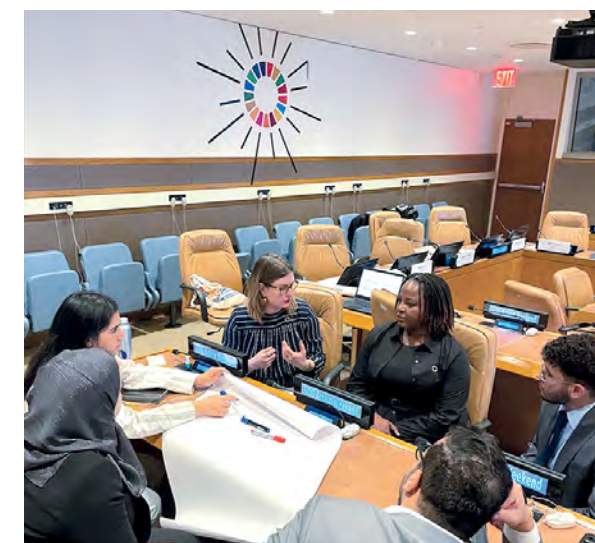
Des participants assistent à l'atelier axé sur la jeunesse organisé par le SDG Lab, au Siège de l'ONU, le 16 septembre.

À Genève, le SDG Lab , pleinement conscient du rôle joué par l'ONU Genève dans la promotion du multilatéralisme en réseau, a organisé le 28 septembre, en collaboration avec l' Institut de hautes études internationales et du développement et le bureau de Genève du Programme des Nations Unies pour le développement , la Journée des objectifs de développement durable, au cours de laquelle l'ensemble de la Genève internationale a pu débattre des moyens de promouvoir la réalisation