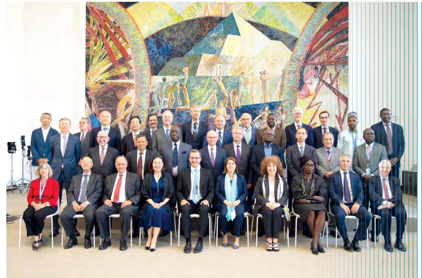
Les membres de la Commission du droit international prennent la pose dans l'Espace événementiel de la Bibliothèque.

Ces initiatives ont une portée qui va bien au-delà du public initialement visé. En effet, grâce à ces projets, le personnel de la Bibliothèque et archives de l'ONU Genève a pu mieux cerner les besoins des clients et le contenu des collections de l'ONU Genève. Cette approche collaborative permet de créer des liens et des partenariats qui sont essentiels pour assurer la pérennité et le développement des services proposés par l'ONU Genève à l'appui du droit international.