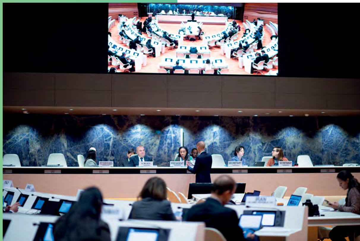
Siège de la Conférence du désarmement – seul organe multilatéral de négociation sur le désarmement de la communauté internationale – l'ONU Genève, par l'intermédiaire du Service de Genève du Bureau des affaires de désarmement de l'ONU, soutient une série d'accords multilatéraux dans le domaine du désarmement et accueille des conférences liées au désarmement.

Alors que l'ONU Genève continue de contribuer à la construction d'un système multilatéral plus inclusif et plus efficace, travaillant davantage en réseau, elle est également devenue le lieu de prédilection pour débattre de sujets émergents, tels que la santé mondiale, le développement de l'intelligence artificielle et la gouvernance numérique, qui seront probablement à l'ordre du jour de la communauté internationale dans les années à venir et qui façonneront l'avenir de la coopération mondiale.