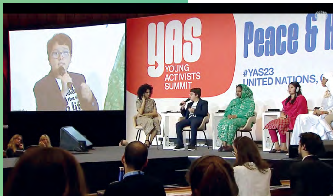
L'animatrice de l'édition 2023 du Sommet des jeunes activistes (à l'extrême gauche) en pleine discussion avec des jeunes militants récompensés pour l'action qu'ils mènent. Consciente du rôle important que peuvent jouer les jeunes s'agissant de repenser et de refaçonner les modèles, l'ONU Genève organise ou accueille régulièrement des manifestations axées sur la jeunesse au Palais des Nations.

Dans la vision qu'il expose, le Secrétaire général souligne le rôle primordial des jeunes pour repenser et refaçonner les modèles qui devront être suivis à l'avenir . Les jeunes peuvent être une force positive pour le développement lorsqu'on leur offre les connaissances et les opportunités dont ils ont besoin pour s'épanouir.